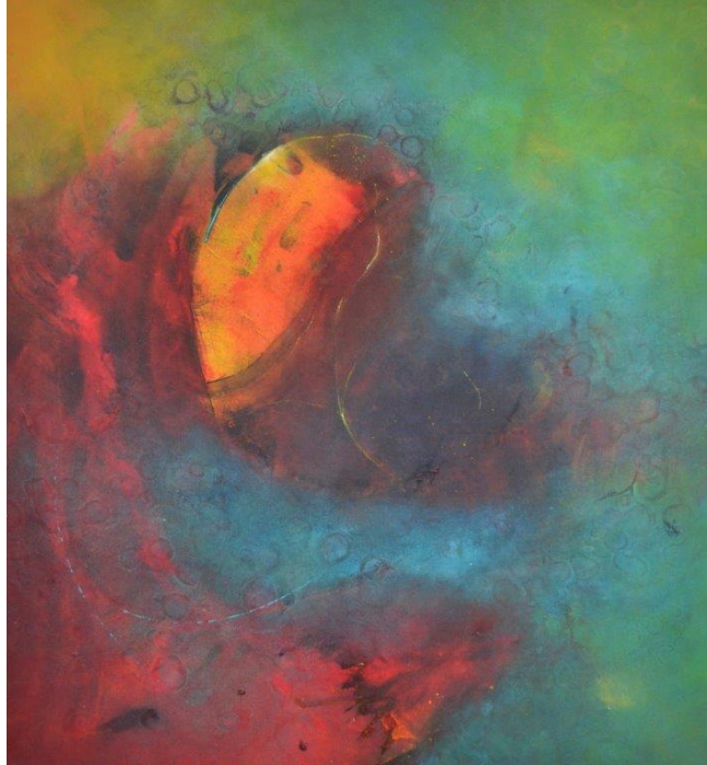
Hinrich JW Schüler. Aquasphere-Bilder

Solche Werke sind nicht vorhersehbar oder planbar; sie entstehen nur aus dem Prozessualen heraus. Wer sich einlässt auf die anfängliche Unsicherheit und Freiheit in der Gestaltung, wird wunderbare Ergebnisse erhalten. Der Kurs ist für Einsteiger und Fortgeschrittene gleichermaßen geeignet.