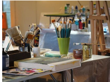
Kursszenen