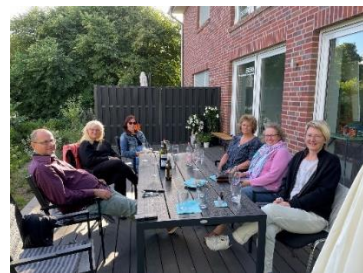
Atelier und Kursleben