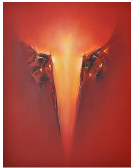
Hinrich JW Schüler: Farbraumbilder