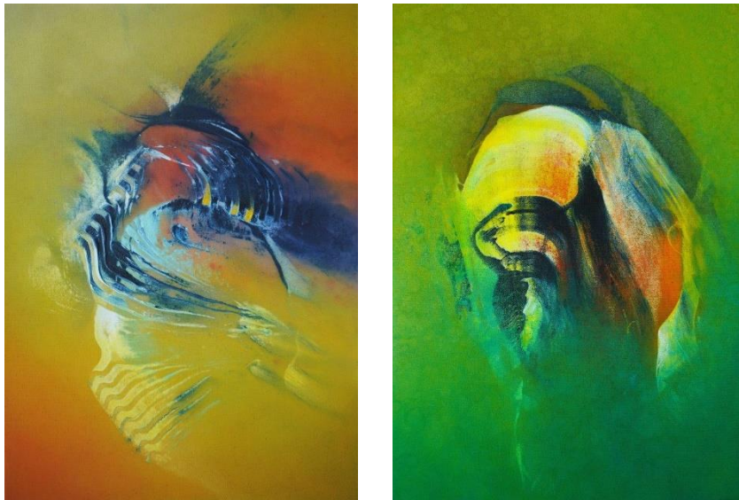
Hinrich JW Schüler; Aquasphere-Bilder

In diesem Kurs malen wir frei-improvisierend und spontan, ohne blockierende Vorlagen, Vorstellungen, Absichten. Wir sehen, was Freie Malerei an wunderbaren Erfahrungen schenkt: ausdrucksstarke und persönliche Bilder mit eigener Stilistik. Aus Arbeitsschritten und Farbschichten wird Geschichte, Entstehungsprozesse werden zum Bestandteil des Werkes. Malerei ist hier eine Entdeckungsreise, bei der die klassischen Acrylmaltechniken durch Experimente und spontane Ideen gestalterisch erweitert werden: Formen entwickeln sich aus dem Spiel der Farben. Und aus Flächen, Linien, Strukturen auf der Fläche entfaltet sich Räumlichkeit. Hinrich Schüler unterstützt dabei unsere Arbeit korrigierend und mit Kurzvorträgen zu Komposition und Farbenlehre.