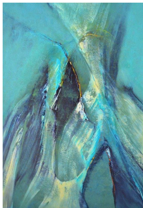
Hinrich JW Schüler: Aquasphere-Bilder