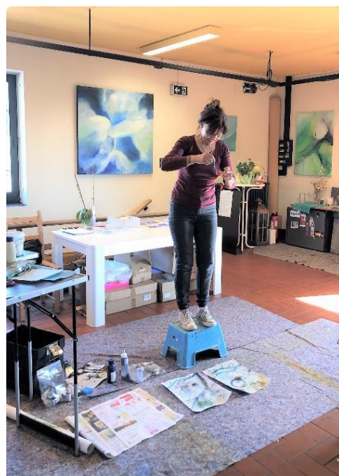
Kurseinblicke; einfach Sein und Experimentieren