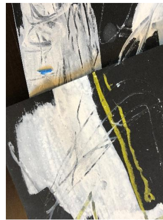
Momentaufnahmen, Anne Schwabe

Trau Dich! Wie gerne halten wir an dem fest, was da und bekannt ist.