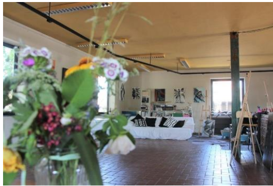
Atelier PLAN:A